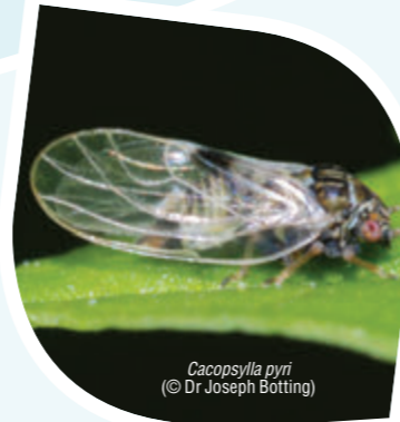
Cacopsylla pyri (© Dr. Joseph Botting)